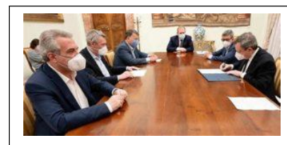
Il premier Draghi con i leader di Cgil, Cisl e Uil

«Siamo a un bivio», ha spiegato. Bisogna cambiare passo, e andare più veloci. La scuola è «un motore della trasformazione sociale», e «consiste nel rendere aperto a tutti l'accesso effettivo all'istruzione e alla cultura, per permettere che emergano talenti che altrimenti resterebbero inespressi. Così è scritto nella nostra Costituzione».