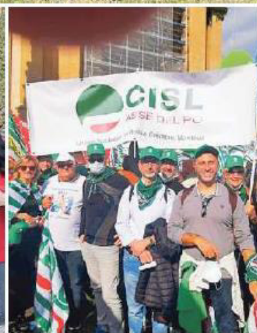
Alcune immagini della partecipazione mantovana alla manifestazione della Cgil. A destra: la Cisl

mo intimidire - ci dice dalla manifestazione - Noi crediamo in un Paese che valorizzi il lavoro, la partecipazione e la democrazia; e oggi possiamo dire che la democrazia è in questa piazza. Ed è questa l'Italia che vogliamo”.