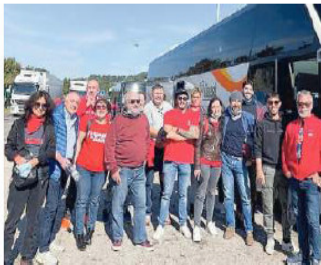
Un gruppo di militanti della Cgil in viaggio

Le piazze no vax che venerdì alternavano fiori regalati ai poliziotti agli insulti a Liliana Segre e Maurizio Landini oggi sono davvero lontane, sulla strada Mantova-Roma si respira tutta un'altra aria in questo sabato che deve ancora iniziare. Una settimana esatta fa l'attacco fascista alla sede nazionale della Cgil, uno sfregio alla casa dei lavoratori e a quello che rappresenta. La ferita brucia ancora, fa paura. Ma questa è la giornata della risposta che non poteva non esserci, dell'orgoglio, della militanza, del lavoro. E a prevalere è la voglia di esserci per tirare una riga contro qualsiasi rigurgito fascista. Per spezzare l'onda nera tornata a minacciare Costituzione e democrazia. Perché è da qui che anche oggi, anche nel 2021, bisogna ripartire. E